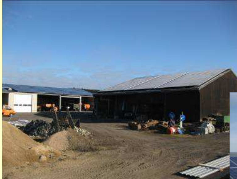
PV Bauhof Freilingen