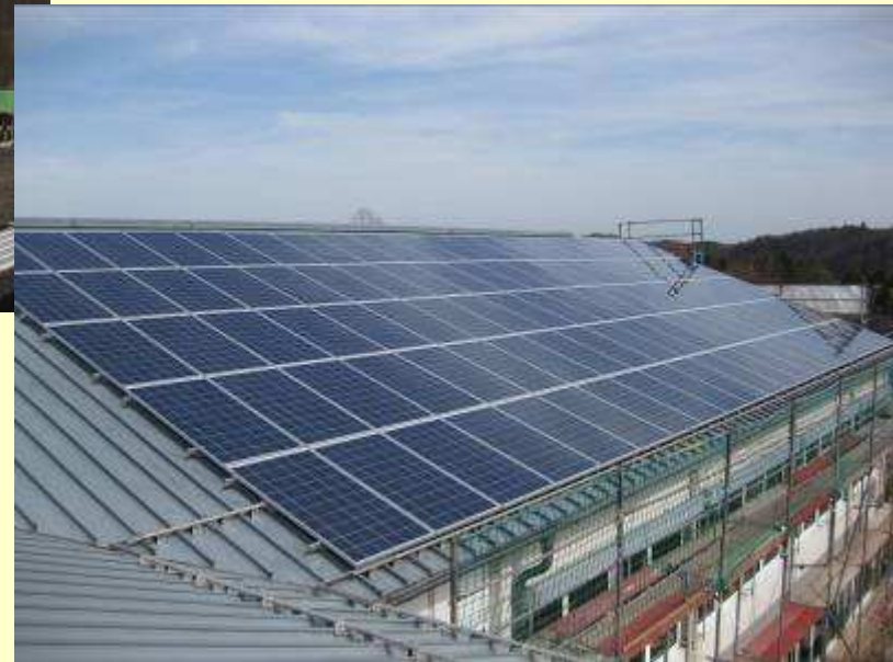
PV Grundschule Blankenheim